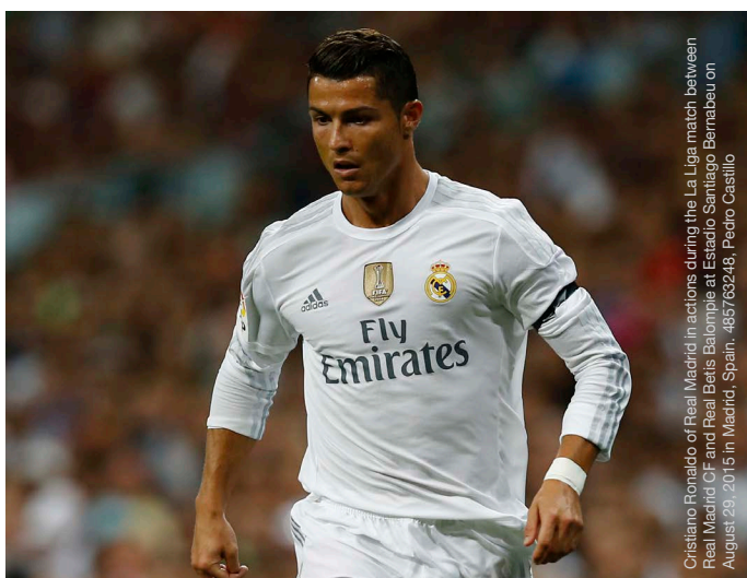
Cristiano Ronaldo of Real Madrid in actions during the La Liga match between Real Madrid CF and Real Betis Balompie at Estadio Santiago Bernabeu on August 29, 2015 in Madrid, Spain.

En cuanto al uso de una imagen donde aparece un deportista es necesario contar con las autorizaciones oportunas, teniendo en cuenta quién/es es/son el/los titular/es de sus derechos de imagen, ya que éstos pueden ser suyos, de un patrocinador o empresa, o del club al que pertenezcan. También hay que tener en cuenta que en el caso de que aparezcan varios jugadores de un equipo en una imagen, no significa que no haya que pedir autorización a nadie, sino que en vez de pedir autorizaciones individuales lo más probable es que haya que pedir autorización al club al que pertenecen.