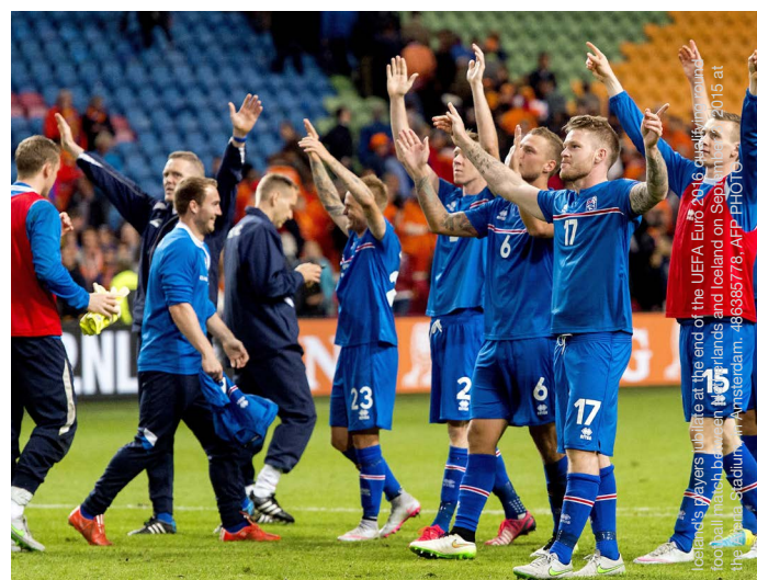
Icelandic players celebrate at the end of the UEFA Euro 2016 qualifying round football match between Iceland and Iceland on September 11, 2015 at the De Kuip Stadium in Amsterdam.