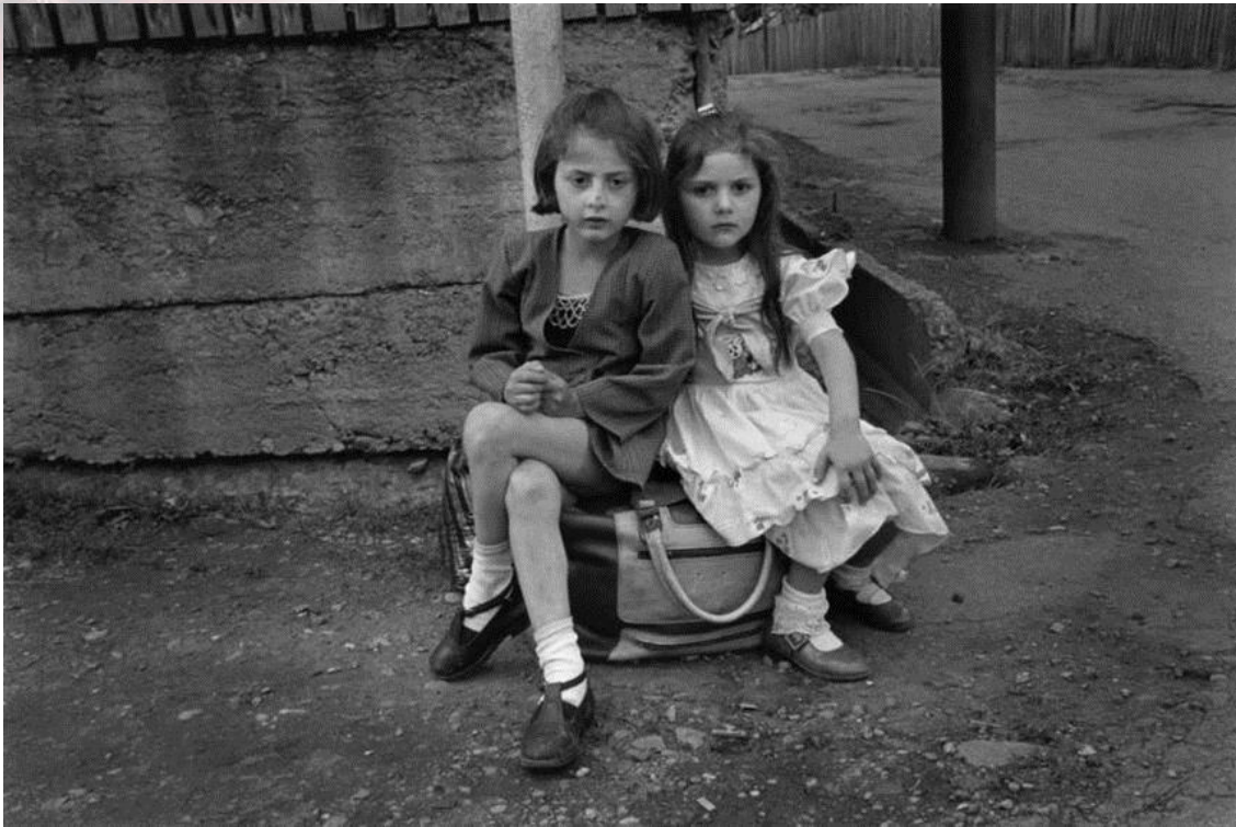
Cristina García Rodero, serie Georgia (1995-2013) Galería Juana de Aizpuru

Vuelve Cristina García Rodero a la galería Juana de Aizpuru.